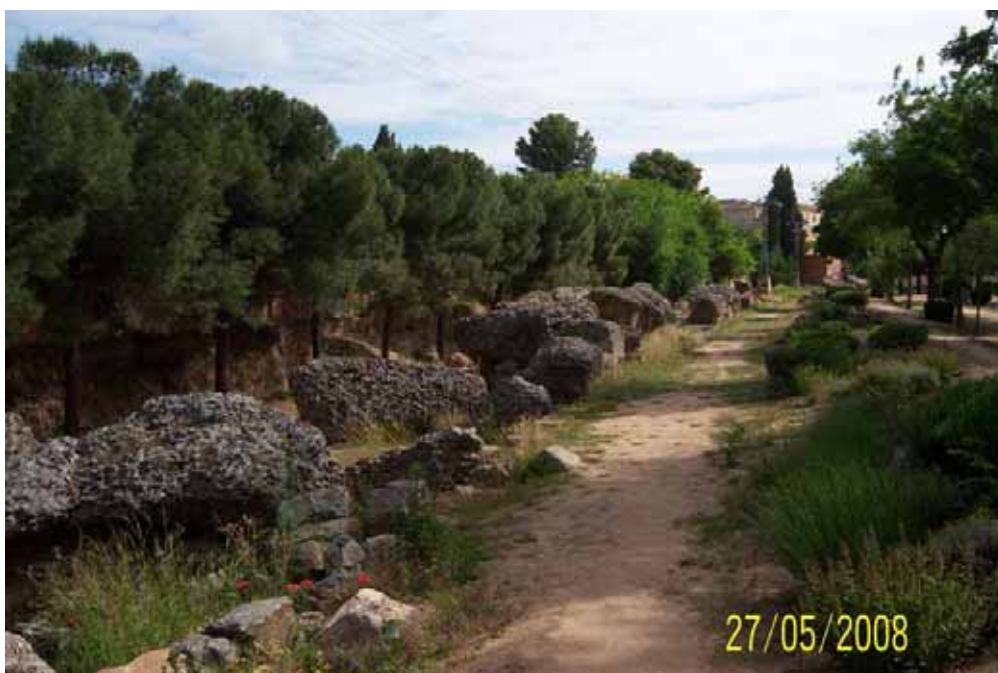
Foto nº 1: Restos de los graderíos en la parte acondicionada del circo

Ante semejante y bochornosa situación, Ecologistas en Acción se ha propuesto promover la recuperación integral del circo romano de Toledo con el objeto de que se convierta en el monumento de referencia que nunca debió dejar de ser y de propiciar un espacio para el uso y disfrute del ciudadano.