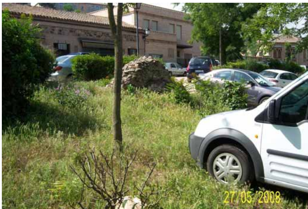
Foto nº 8: Coches aparcados sobre los restos de los graderíos del circo romano.

Finalmente, uno de los restos de construcciones más notables del circo romano, una pared que cuenta con un arco, y que se encuentra situada detrás del restaurante Venta de Aires, se encuentra en un estado de abandono lamentable, rodeada de basura, escombros y maleza.