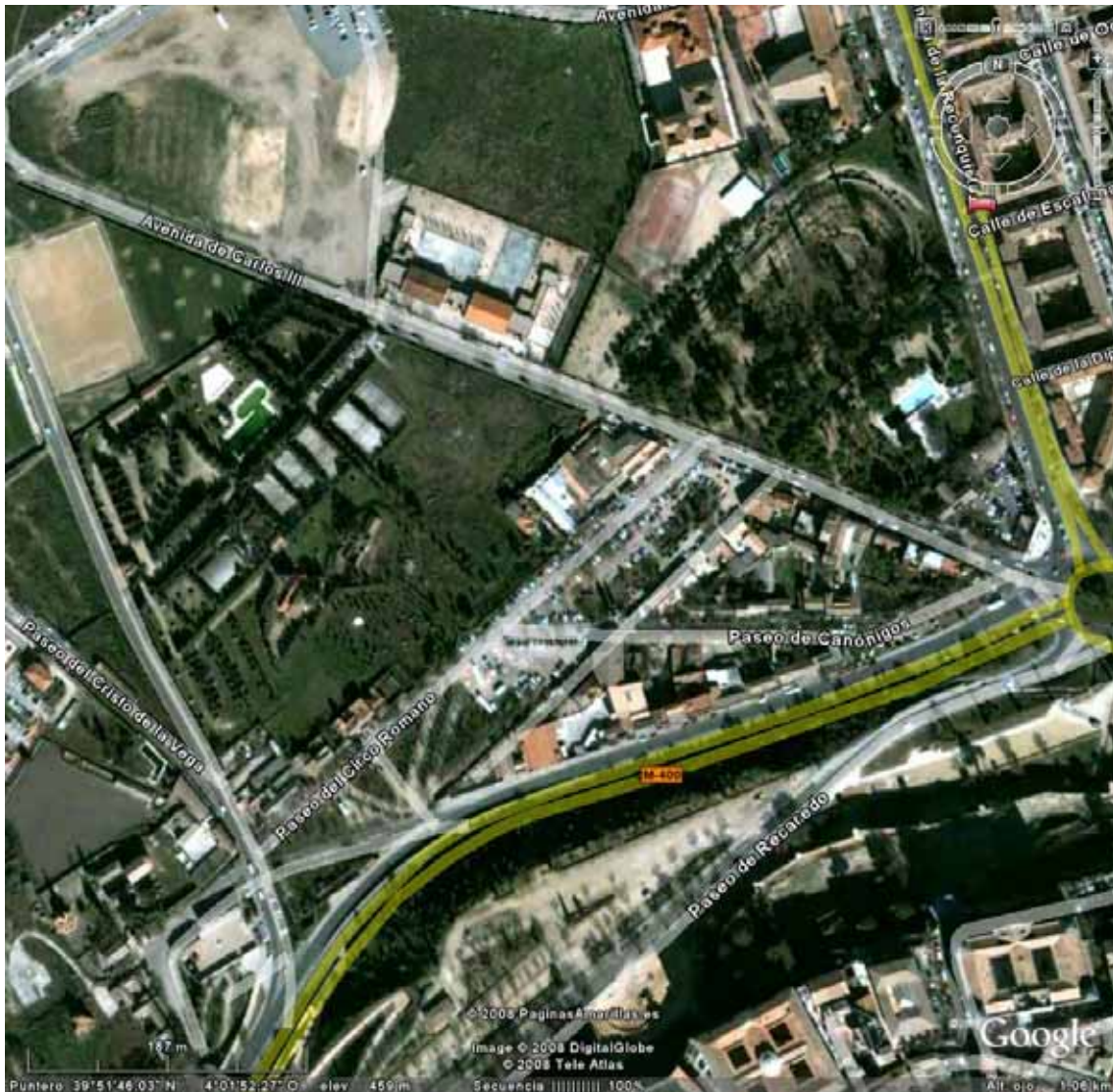
Foto n° 2: Vista desde el aire del emplazamiento del circo romano de Toledo. Sólo se aprecia la parte conservada del circo mantenida dentro del parque Campo Escolar