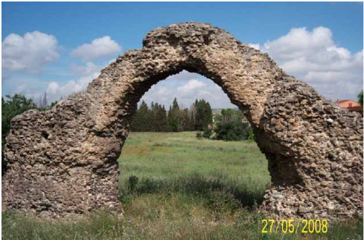
Foto nº 3: Arco completo perteneciente del circo romano de Toledo

Actualmente todavía se conservan importantes restos constructivos de este circo romano, advirtiéndose además la presencia de muchos más restos enterrados o cubiertos por vegetación.