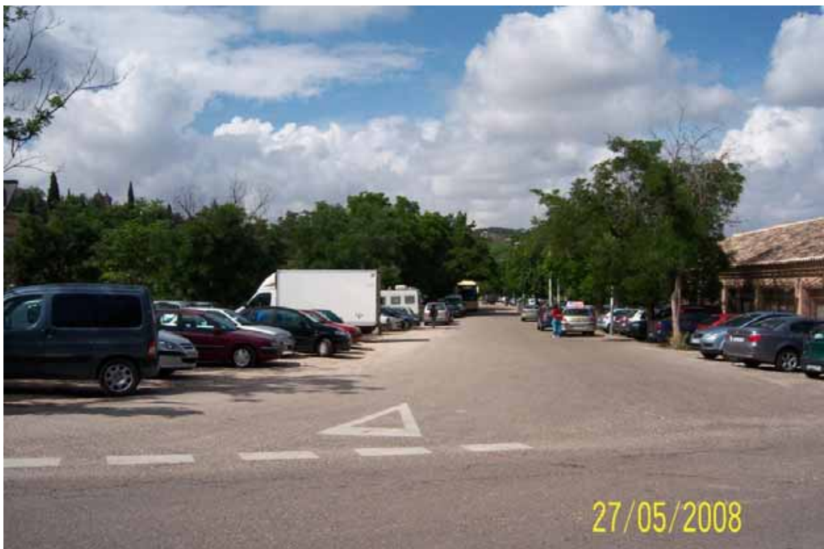
Foto nº 6: Paseo sobre el circo Romano. A la derecha construcciones sobre el circo (Venta de Aires)